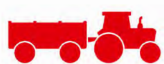
Skog- og landbruk